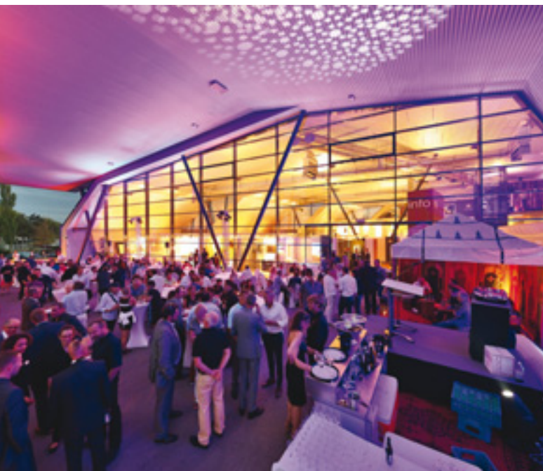
Eröffnung der Elements Bad-Ausstellung der GC-Gruppe, Euro-industriepark München