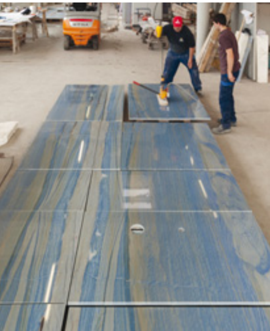
Abnahme-Vorbereitung in der Produktion

tekten und Kunden abnehmen, »insbesondere, um sie bei der Bestimmung des Strukturverlaufs mit in den Produktentstehungsprozess zu integrieren«, so Franz Maximilian Huber. Auf diese Weise werden die Baurisiken auf ein Minimum reduziert, unnötiger Dreck auf der Baustelle vermieden, die Arbeitsabläufe in der Montage wesentlich beschleunigt und die Kalkulationsrisiken für alle beteiligten Gewerke und die Bauherren minimiert.