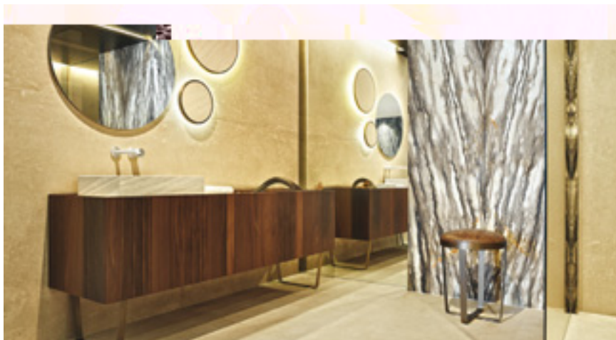
SEQUOIA BROWN & Limestone SAN SEBASTIAN

chen Zeit wurde mit der CNC-gesteuerten Fertigung differenzierter Werkstoffe eine neue Ära der Steinverarbeitung eingeläutet. Die klassischen Granite und heimischen Kalksteine wurden mit Hunderten weltweit abgebauter Gesteinsarten und -sorten ergänzt. Franz Maximilian Huber tauschte die JURA-Gatter des elterlichen Betriebs gegen CNC-Maschinen für die hochwertige Steinbearbeitung aus. Da es für diese Art der Verarbeitung noch keine ausreichend geschulten Fachleute gab, blieb Franz Maximilian Huber nichts anderes übrig als selbst auszubilden – eine gute Investition, denn das Fachpersonal gehört wesentlich zum Kapital des Unternehmens. Der Einzug der digitalen Aufmaßtechnik ermöglichte einen Durchbruch in der exklusiven Fertigung. Seit dem Einzug dieser Technik überlässt das Huber-Team nichts dem Zufall und lässt sich die auf Maß gefertigten Werkstücke grundsätzlich vor dem Einbau vom Archi-