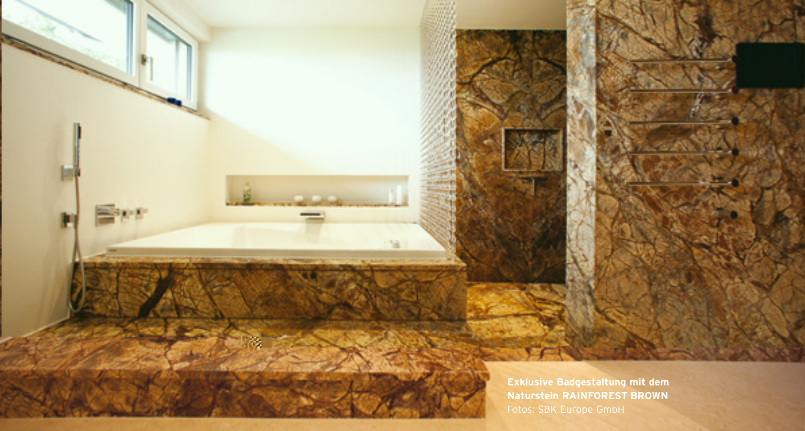
Exklusive Badgestaltung mit dem Naturstein RAINFOREST BROWN