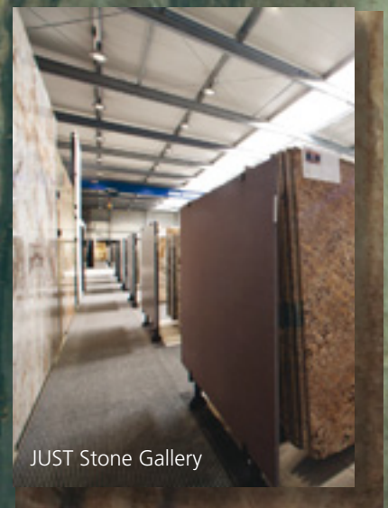
JUST Stone Gallery

Jeden Monat Gestaltungsvorschläge mit Materialien aus dem JUST Lager zum kostenlosen Download im Internet.