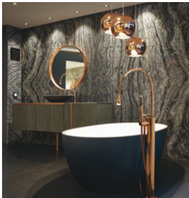
SILVER WAVE, hier kombiniert mit NERO ASSOLUTO

nische Umsetzung der Gestaltung verfügt das Stein-Team Huber über alle Möglichkeiten der Oberflächenbearbeitung (Säge- und Frästechnik etc.). 2012 schaffte die Firma ein Donatoni-Sägezentrum an, 2013 eine Konturendiamantseilsäge für die Fertigung und Modellierung von Massivteilen. Hierdurch bietet sich für Badkunden die Möglichkeit, Waschtische aus einem Stück anfertigen zu lassen. Bei der Renovierung von Gebäuden setzt das Huber-Team auf die moderne 3D-Aufmaßmöglichkeit mittels Flexijet. Die Räume werden millimetergenau vermessen; jede Unebenheit in den Wänden und Böden wird aufgedeckt. Das hieraus resul-